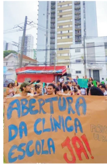
Manifestação de alunos de Fisioterapia cobra mais professores

De acordo com os estudantes, cerca de 500 alunos são afetados pelos problemas estruturais apontados. As disciplinas suspensas são